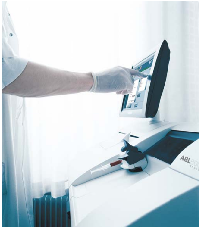
Interface configurable permettant des profils personnalisés.