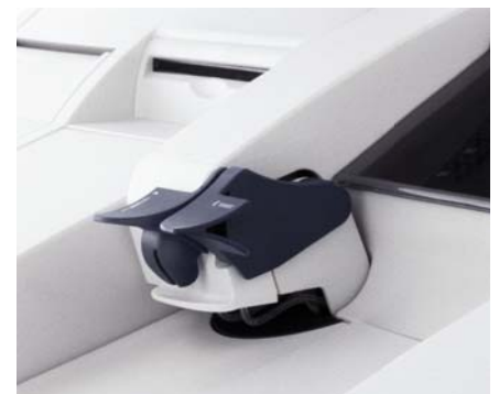
Aspiration automatique de l'échantillon.