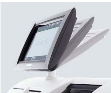
Ecran tactile couleur réglable.