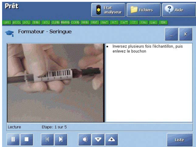
Formateur audio-vidéo, recherche des défauts et aide en ligne.